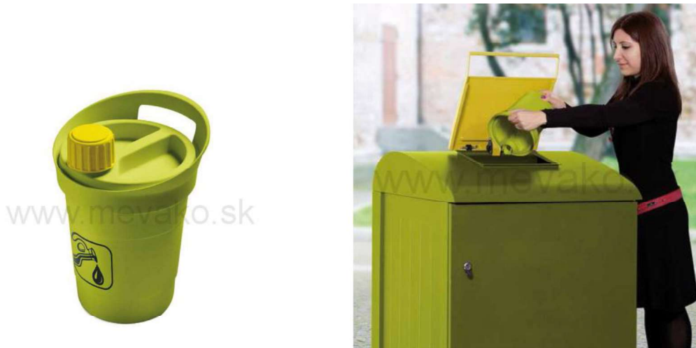
Špeciálne nádoby na odpadové kuchynské oleje.

Legislatíva nestanovuje špecifické požiadavky na dostupný objem ani na početnosť vývozov. Obec môže spolupracovať so subjektami, ktoré zabezpečujú triedený zber jedlých olejov a tukov na území obce (napr. čerpace stanice).