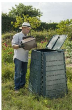
Príklad domáceho kompostovania.