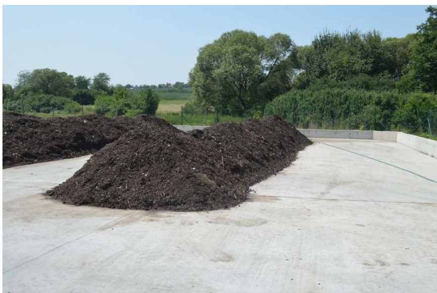
Mestská kompostáreň v Lučenci.

Ak je to nevyhnutné na dodržanie podmienok výkonu kompostovania, do malej kompostárne sa okrem troch druhov odpadov uvedených v tabuľke môže prevziať aj komunálny odpad, ktorý sa podľa Katalógu odpadov zaraďuje pod katalógové číslo 20 02 02 Zemina a kamenivo, ale iba v množstve nevyhnutnom na dodržanie ustanovených podmienok.