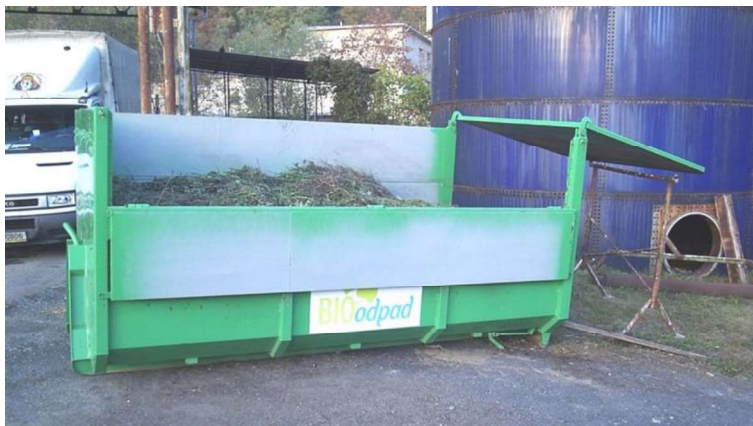
Zber zeleného odpadu v Liptovskom Mikuláši.

Okrem toho musí obec zabezpečiť kampaňový sezónny zber biologicky rozložiteľného komunálneho odpadu najmenej dvakrát do roka, a to v jarom a jesennom období.