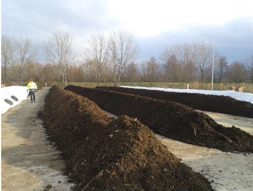
Príklad kompostovania na hromadách.

Aeróbny rozklad sa uskutočňuje kompostovaním v kompostárňach. Kompostárne môžu byť prevádzkované obchodnou spoločnosťou, ale aj obcou. Obec môže prevádzkovať aj tzv. malú kompostáreň.