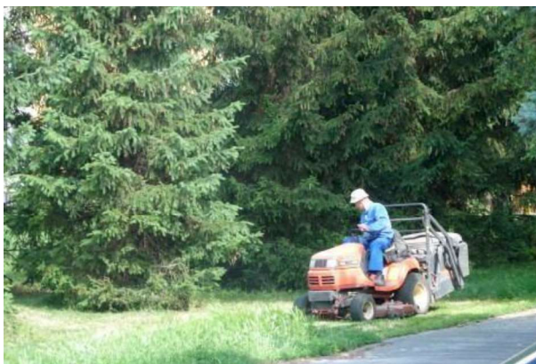
Starostlivosť o obecnú zeleň.

Je samozrejmosťou, že pre zelené odpady, ktoré vznikajú pri starostlivosti o obecnú zeleň (obecné parky, zelené plochy, trávniky, kvetinová výzdoba, cintoríny), obec zabezpečí ich triedený zber a spracovanie, napríklad na obecnej kompostárni.