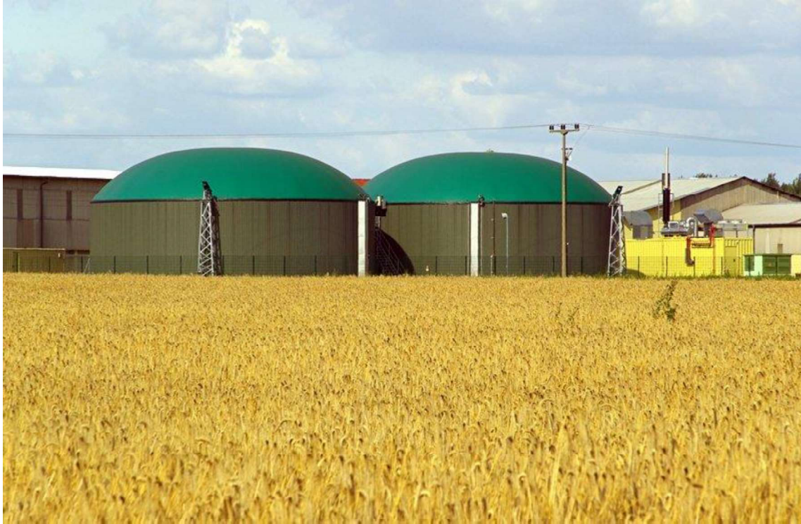
Bioplynová stanica.