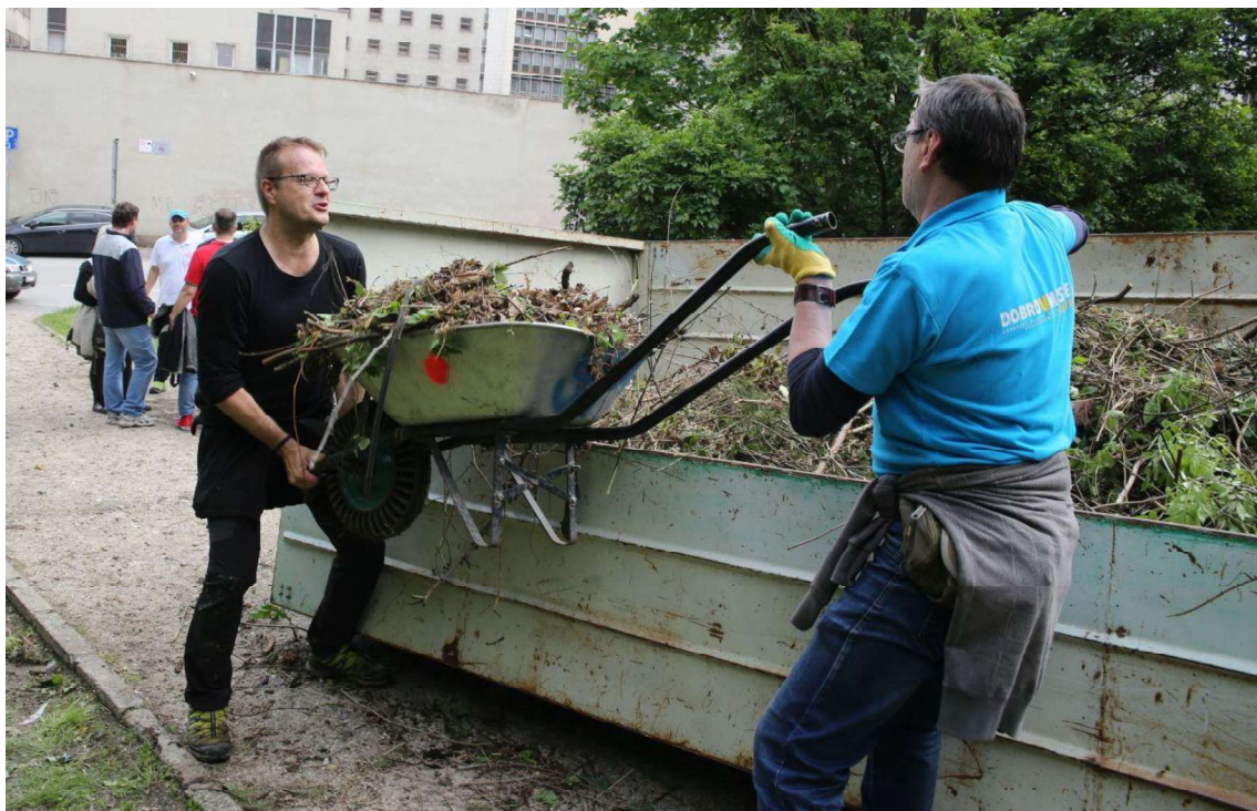
Zeleň z údržby cintorína.

Obec sa však musí postarať aj o zelené odpady, ktoré vznikajú v jednotlivých domácnostiach. Domácnosti môžu buď samé kompostovať odpad, ktorý v nich vzniká pri starostlivosti o záhradu alebo trávnatú plochu, alebo majú mať možnosť zelené odpady odovzdať obci, ktorá následne zabezpečí ich spracovanie.