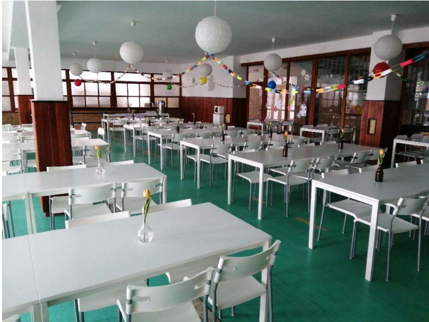
Školská jedáleň ZŠ Chrenovec

V prevádzkach, v ktorých sa pripravuje a vydáva jedlo a nápoje, vznikajú reštauračné odpady, s ktorými sa nakladá rovnako ako s kuchynskými odpadmi vzniknutými v domácnostiach. Zodpovednosť za zber a nakladanie s nimi však nemá obec, ale prevádzkovateľ takéhoto zariadenia.